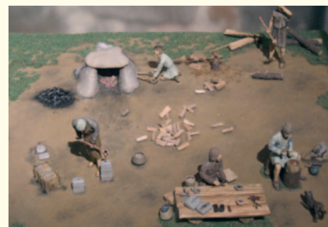
rechts: Rekonstruktion einer bronzezeitlichen Bronzegießer-Werkstatt (Maßstab 1:15), jede Figur stellt eine Phase des Herstellungsprozesses dar.

Figuren beleben ein Diorama, aber ihr Einsatz ist durchaus nicht unproblematisch. Figuren ziehen die Aufmerksamkeit des Besuchers auf sich und können sogar für das Verständnis des Modells hinderlich sein. Deshalb sollten Figuren sparsam und überlegt eingesetzt werden, und jede Figur sollte eine klare Funktion haben. Was in einem Modell gezeigt wird, kann schwer relativiert werden. Manchmal kann es ratsam sein, die "Macht" der Figuren durch Verfremdung einzuschränken, z. B. indem man sie einfarbig bemalt oder nicht realistisch darstellt. Besonders in der Darstellung von körperlichen, zum Beispiel „ethnischen“ Merkmalen, sollte gut überlegt werden, was rekonstruiert wird oder nicht.