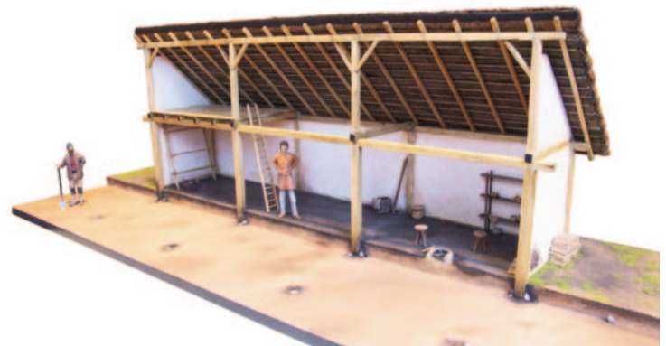
Links: Römische Privatarchitektur (Maßstab 1:5), rechts: Keltisches Wohnhaus, Halstattzeit (Maßstab 1:13) Die Figuren fungieren hier als Maßstab und erlauben die sofortige Wahrnehmung der Größenordnung der Rekonstruktionen.

Die Figuren sind natürlich auch ein probates Mittel, um menschliche Tätigkeiten darzustellen. Handwerkliche, landwirtschaftliche, alltägliche Aktivitäten oder Raumnützung, die Möglichkeiten sind zahlreich.